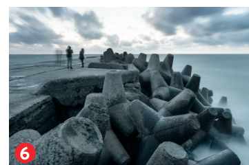
6 Ziemeļu mols Northern breakwater