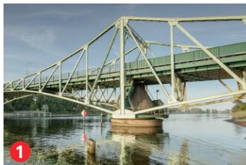
1 Oskara Kalpaka tilts Oskars Kalpaks bridge