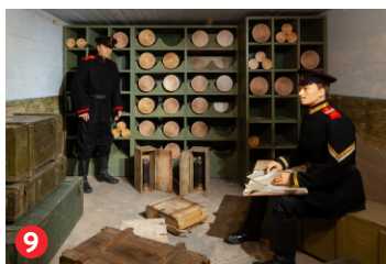
9 Ekspozīcija cietokšņa baterijā Nr. 2 Exposition in Fortification battery No. 2