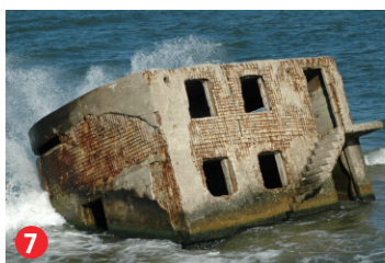
7 Cietokšņa baterija Nr. 3 Fortification battery No. 3