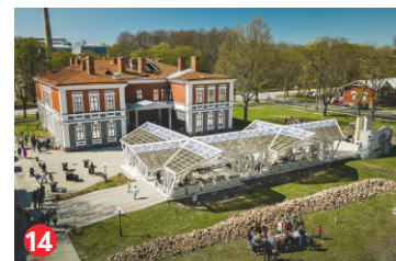
14 Kultūrvieta "Atmodas dārzs" Cultural space "Atmodas dārzs"