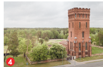
4 Karostas ūdenstornis Karosta water tower