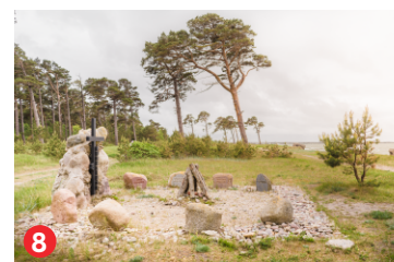
8 Piemīņas vieta kureļiešiem Memorial place to the Kurelians