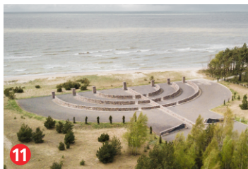
11 Memoriāls holokausta upuriem Memorial to the Holocaust victims