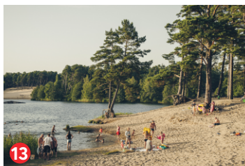
13 Beberliņu atpūtas parks Beberliņi recreational park