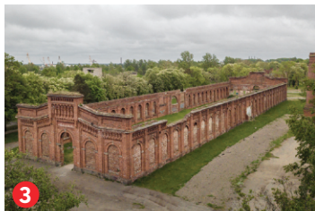
3 Karostas manēža Karosta manege