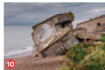
10 Ziemeļu forti Northern forts