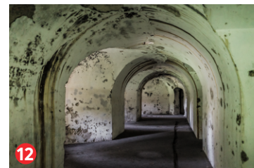
12 Redans un Karostas un Neatkarības kara muzejs Redan and Karosta and Independence War Museum