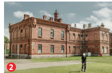
2 Karostas cietums Karosta prison